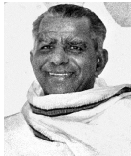
സി.എം. സ്റ്റീഫൻ പാർലമെന്റ് അംഗം പാർലമെന്റ് പ്രതിപക്ഷ നേതാവ് കേന്ദ്ര ക്യാബിനറ്റ് മന്ത്രി