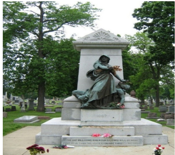
തൂക്കിലേറ്റിയവരെ അടക്കം ചെയ്ത ചിക്കാഗോയിലെ ഫോറസ്റ്റ് പാർക്ക് സെമിത്തേരിയിലെ സ്മാരകം

“ഇന്ന് നിങ്ങൾ അവസാനിപ്പിക്കുന്ന ഞങ്ങളുടെ ശ്വാസോച്ഛ്വാസത്തേക്കാൾ ഞങ്ങളുടെ നിശബ്ദത വൻ ശക്തിയായി വരുന്ന ഒരുദിവസം വരും”. തൂക്കുകയർ കഴുത്തിൽ അണിയിച്ചപ്പോൾ തൊഴിലാളി നേതാക്കൾ അവസാനമായി പറഞ്ഞ ഈ വാക്കുകൾ തൊഴിലെടുത്ത് ജീവിക്കുന്ന ഏതൊരു തൊഴിലാളിയ്ക്കും ഇന്നും ആവേശമാണ്. രക്തസാക്ഷികളായ ഇവർ ഏതെങ്കിലും രാഷ്ട്രീയ കക്ഷികളിൽപ്പെട്ടവർ ആയിരുന്നില്ല. മറിച്ച് പണിയെടുത്ത് ജീവിച്ചിരുന്ന സാധാരണ തൊഴിലാളികളായിരുന്നു എന്ന തിരിച്ചറിവ് ഈ സംഭവത്തിന്റെ ഗൗരവം വർദ്ധിപ്പിക്കാനിടയാക്കി.